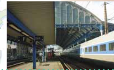
La gare de Dax